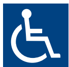
Símbolo internacional da pessoa com deficiência