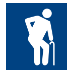
Símbolo internacional da pessoa idosa