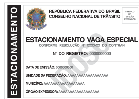
Cartão do Idoso

O cartão do idoso é uma autorização especial para o estacionamento de veículos, conduzidos por idosos ou que os transportem, nas vias e logradouros públicos e na Zona Azul, em vagas exclusivas, devidamente sinalizadas para este fim.